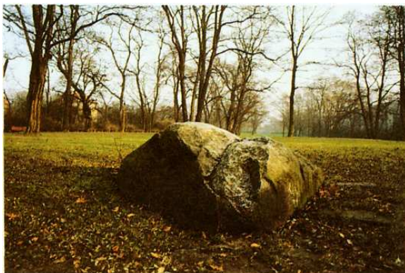
Granitfindling im Akazienwäldchen

Als man 1950 den ostwestlichen Parkweg anlegte, stieß man hier auf 17 Urnen, die zum Teil durch darübergestülpte Schalen bedeckt in den Mergelboden eingetieft worden waren. Der Fundort gehört zum Gebiet der Kienheyde: ursprünglich ein Waldgebiet, das sich bis nördlich des Teltowkanals erstreckte. Zu Beginn des 19. Jahrhunderts wurde es abgeholzt und später zur Kiesgewinnung genutzt. Dabei stieß man immer wieder auf Relikte aus urgeschichtlicher Zeit. Die Gräber, die man östlich des Krankenhauses fand, enthielten Leichenbrand, bei dessen genauerer Untersuchung die Reste von 7 Frauen, 2 Männern und 3 Kindern bestimmt werden konnten, während bei den restlichen Toten eine Geschlechts- und Alterszuweisung nicht mehr möglich war. Die Toten lagen jeweils einzeln, nur in einer Urne war eine Mutter zusammen mit ihrem Kind beigesetzt worden. Für heutige Verhältnisse waren diese Menschen recht jung gestorben, denn das Durchschnittsalter betrug nur 20-35 Jahre. Besonders die weiblichen Toten waren mit reichem Schmuck verbrannt worden, dessen Reste -eiserne Ziernadeln, Gewandspangen, Gürtelhaken sowie bronzene Ohrringe und Zierplättchen- in den Urnen enthalten sind. Anhand dieser Beigaben kann man die Gräber in das 5. vorchristliche Jahrhundert datieren. Sie gehören zu der sogenannten Jastorf-Kultur , die sonst vor allem nördlich von Berlin verbreitet war und deren Träger häufig bereits als Germanen bezeichnet werden.