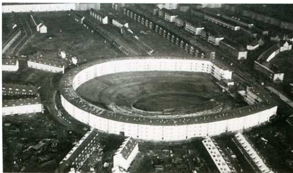
Hufeisensiedlung in Britz, Aufnahme 1931

Als man die Baugruben für die Häuser der Hufeisensiedlung aushob, fanden die Arbeiter immer wieder Gegenstände aus urgeschichtlicher Zeit, darunter vor allem Bruchstücke von Tongefäßen. Anhand dieser Materialien konnte festgestellt werden, daß hier schon früher Wohnstätten gelegen haben müssen. Südlich und südwestlich des Teiches hatte es eine bronzezeitliche (2. Hälfte des 2. Jahrtausends v. Chr.) und später eine Siedlung der germanischen Semnonen (1.-2. Jahrhundert n. Chr.) gegeben. Westlich des Teiches fanden sich dagegen jungsteinzeitliche Siedlungsreste (3. Jahrtausend v. Chr.). Neueste Untersuchungen, die anlässlich einer Ausbaggerung des Pfuhs stattfanden,