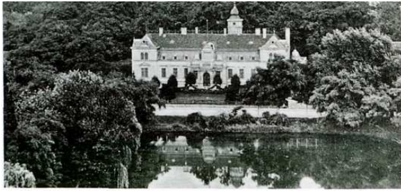
Herrenhaus des Gutes Britz, Aufnahme um 1920

Die Wirtschafts- und Stallgebäude, die heute den Gutshof umgeben, stammen aus der zweiten Hälfte des 19. Jahrhunderts. Sie wurden vor einigen Jahren von der Denkmalpflege sorgfältig restauriert. Von der ehemaligen Brennerei ist noch der Schornstein vorhanden.