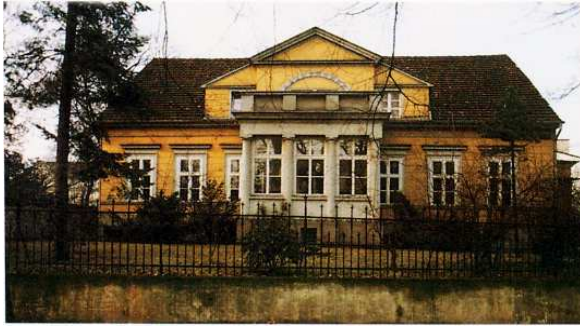
Pfarrhaus auf dem Kirchhügel in Britz