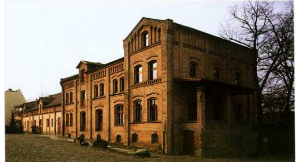
Ehemalige Wohn- und Wirtschaftsgebäude des Gutshofs Britz

Über das mittelalterliche Britz sind wir aus historischen Quellen informiert. 1375 wurde das Dorf erstmals im Landbuch Kaiser Karls IV. als „Britzik“ erwähnt. Es bestand aus 58 Hufen