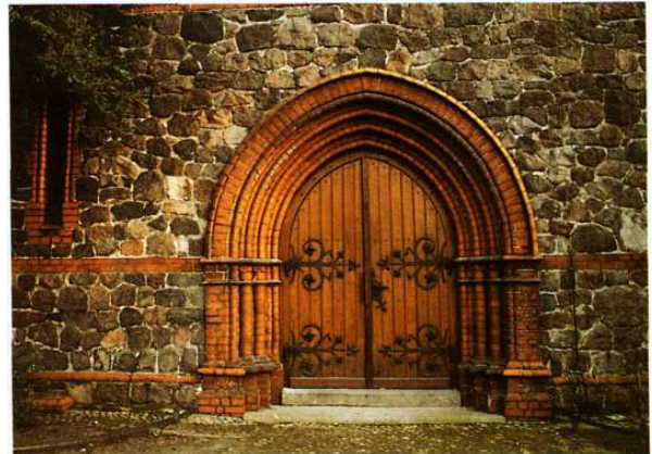
Portal der Britzer Dorfkirche

Wir wenden uns nun dem rechts neben der Kirche liegenden Hügel zu, auf dem sich heute das Pfarrhaus mit einer sehenswerten klassizistischen, durch dorische Säulen gegliederten Veranda befindet.