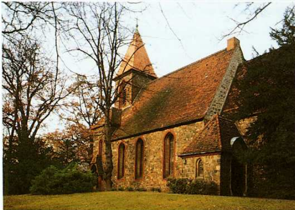
Die Dorfkirche Britz, 13. Jahrhundert