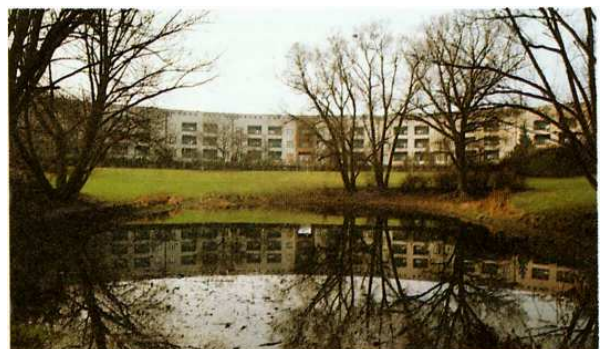
Teich der Hufeisensiedlung Britz

Die Siedlungen um den Hufeisenteich liegen noch im Bereich des schweren Geschiebelehms am Rande des Urstromtals der Spree. Als Wasserreservoir diente der Teich, denn es gibt in der Nähe keine Bäche. Er entstand am Ende der letzten Eiszeit als sich die Gletscher zurückzogen und vielerorts riesige zerfallende Eisblöcke zurückblieben. Die Schmelzwässer lagerten um diese Blöcke herum Erdmassen ab, so daß das auftauende Eis nicht mehr abfließen konnte, sondern kleine Teiche bildete. Diese sogenannten Kolke oder Sollen sind im Britzer Moränenbereich häufiger zu finden; sie stellten meistens das Zentrum von Siedlungsplätzen der unterschiedlichsten Epochen dar.