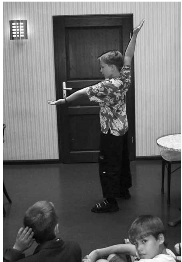
„Klappe die Erste!“

involve conflicts and stories from everyday life in the family. For an entire week, scenes were written, discussed and rehearsed. The museum changed into an imaginary stage theater and the schoolchildren into actors. For many, it was their first experience with the theater. Nevertheless, what pleased the children most of all, was that they didn't have to learn their lines by heart and that their parents truly enjoyed their performance.