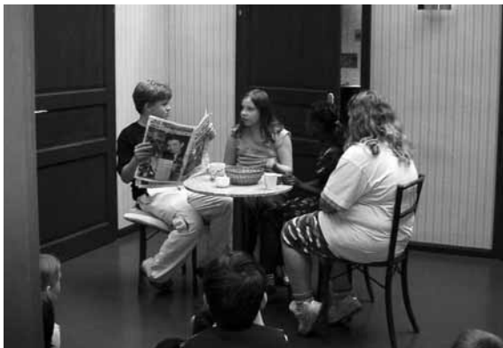
„Das ist die Realität!“