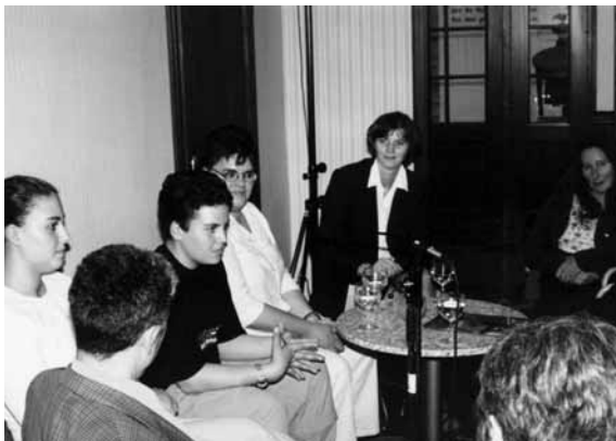
Talk mit Familie Boro