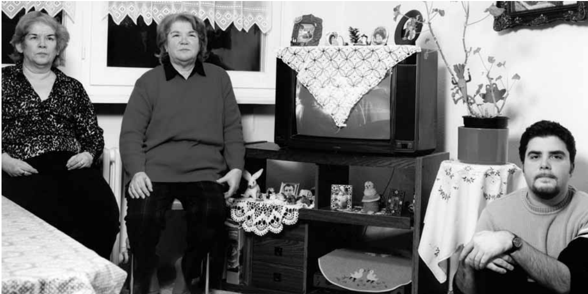
Familie Klaitzidis (Pontos-griechen)